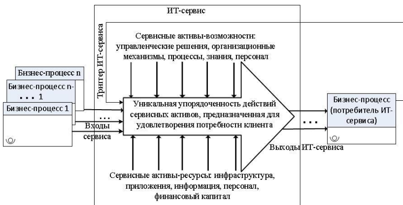
Рисунок 2. Структура ИТ-сервиса как процесса