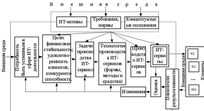
Рисунок 1. Процессуальные компоненты ИТ-деятельности

Состав ИТ-активов, механизмы функционирования и управления должны соответствовать портфелю сервисов ИТ-провайдера и обеспечивать поставку таких услуг, которые отвечают требованиям клиентов, имеют приемлемую рыночную цену и допустимые риски применения. Это означает, что ИТ-сервисы предопределяют структуру активов, а также механизмы функционирования и управления ИТ-деятельностью. Данное обстоятельство требует особого внимания к понятию «ИТ-сервис». Значительным продвижением в этом направлении стало следующее определение, введенное в ИТГЛ (версия3) [9].